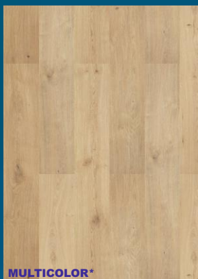
52350 dąb Light Grey MIX