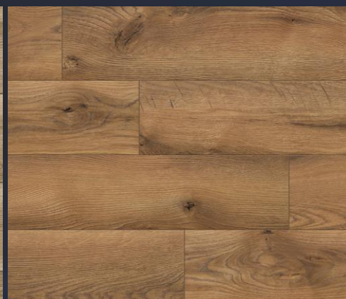
50672 dąb Venti