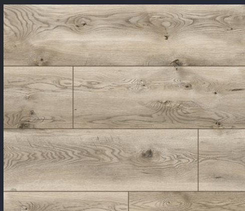
50858 dąb Regio