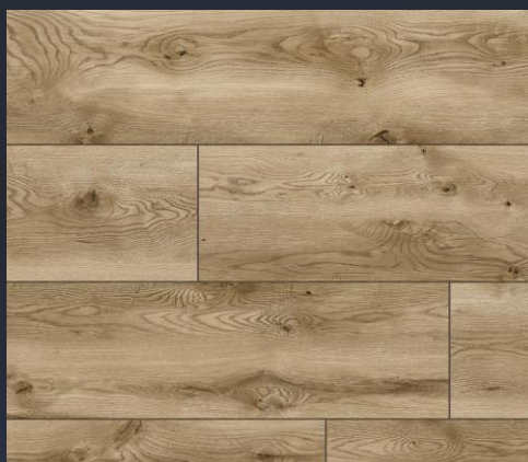
50674 dąb Teramo