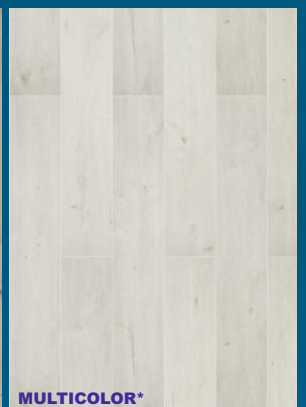
52375 dąb Light Brown MIX