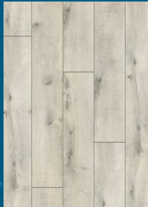
52348 dąb Creme