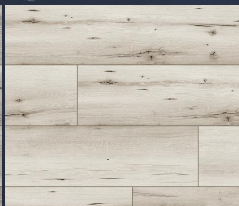
50841 dąb Hers