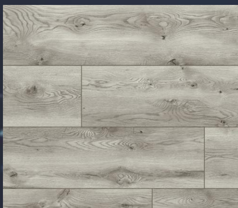
50857 dąb Diestro