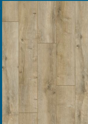
52349 dąb Soft Brown