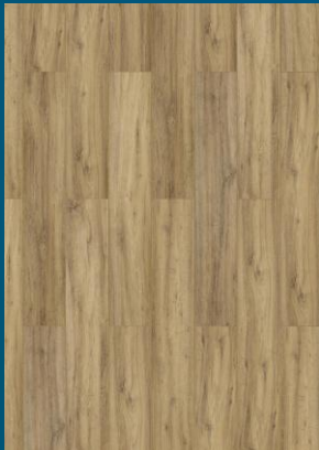
52344 dąb Natural

1286mm x 192mm x 8mm opakowanie: 1,974m 2 / paleta: 94,752m 2