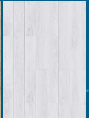
52353 dąb White Creme