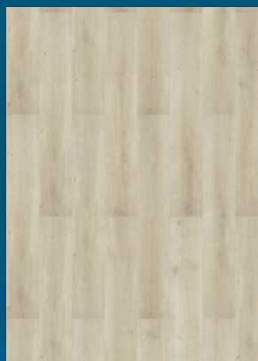
52355 dąb Creme Natural