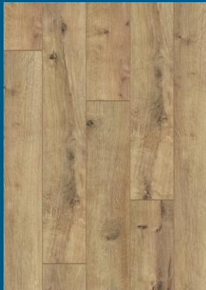
52345 dąb Light Natural